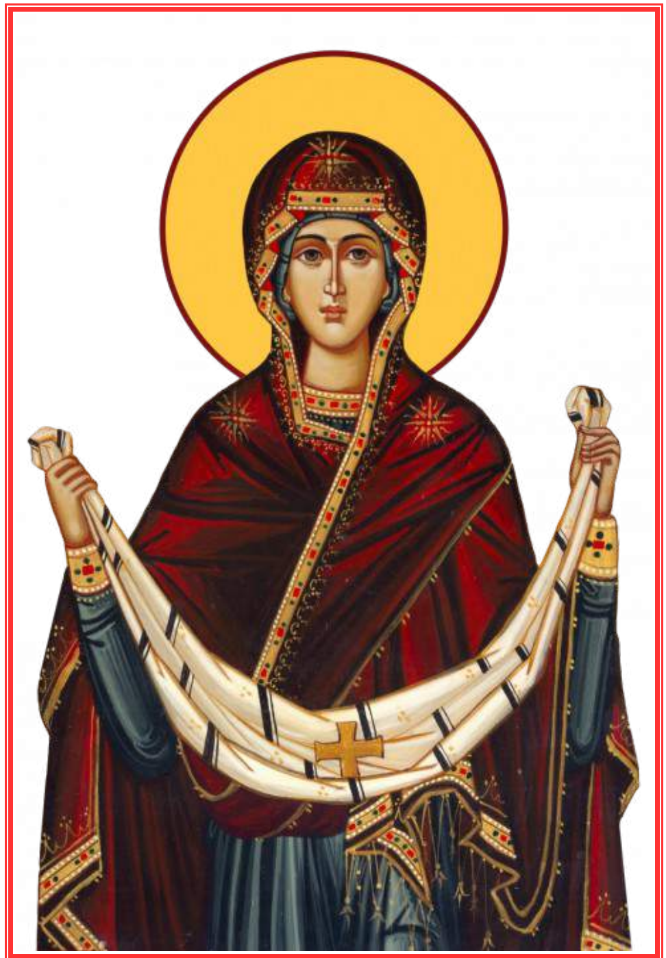
BISERICA SFANTUL NICOLAE - NY