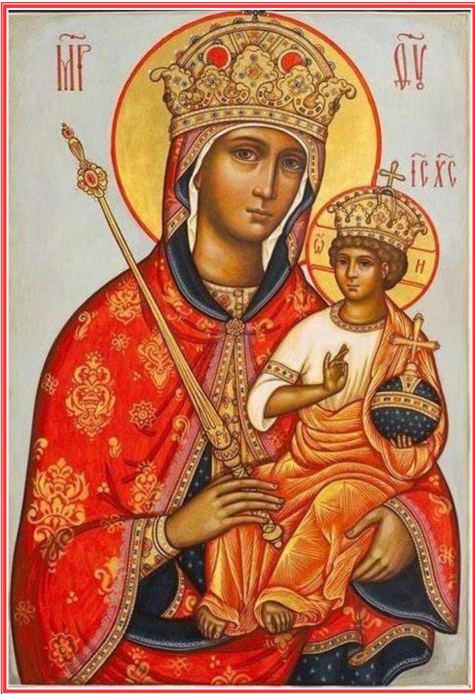
BULETIN PAROHIAL - OCTOMBRIE 2021