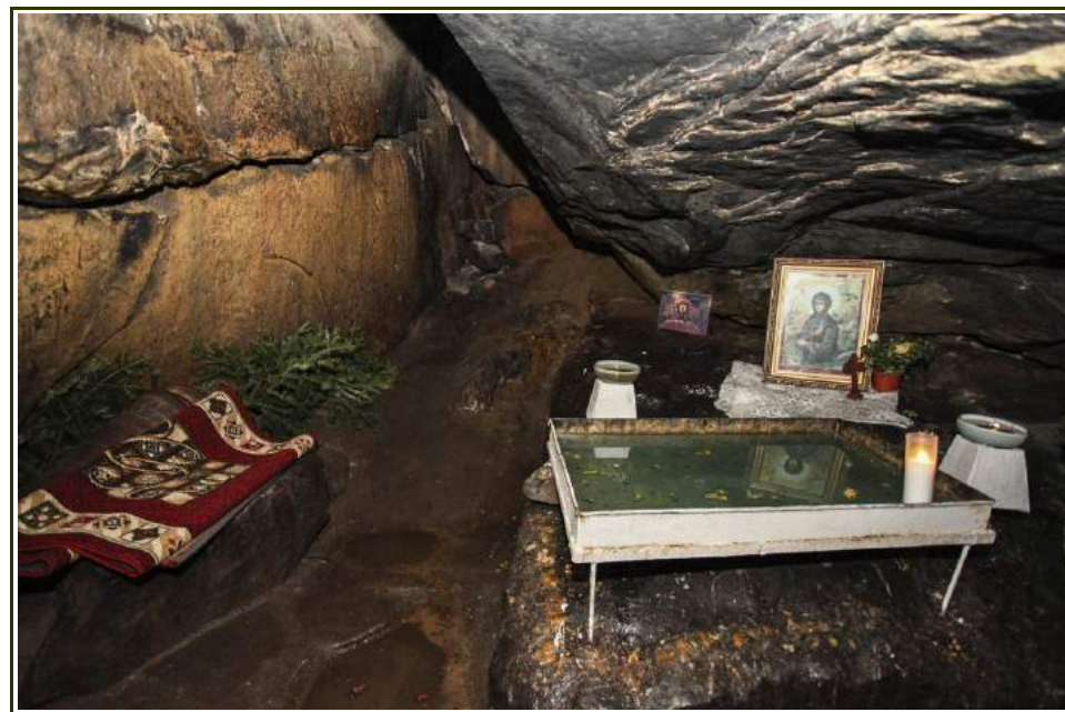
Pestera Sfintei Teodora de la Sihla

La 20 iunie 1992, Sfântul Sinod al Bisericii Ortodoxe Române a canonizat-o, trecând-o oficial în rândul sfinților, cu zi de prăznuire la 7 august. Cu ale ei sfinte rugăciuni, Doamne Iisuse Hristoase, Fiul lui Dumnezeu, miluiește-ne și ne mântuiește pe noi. Amin!