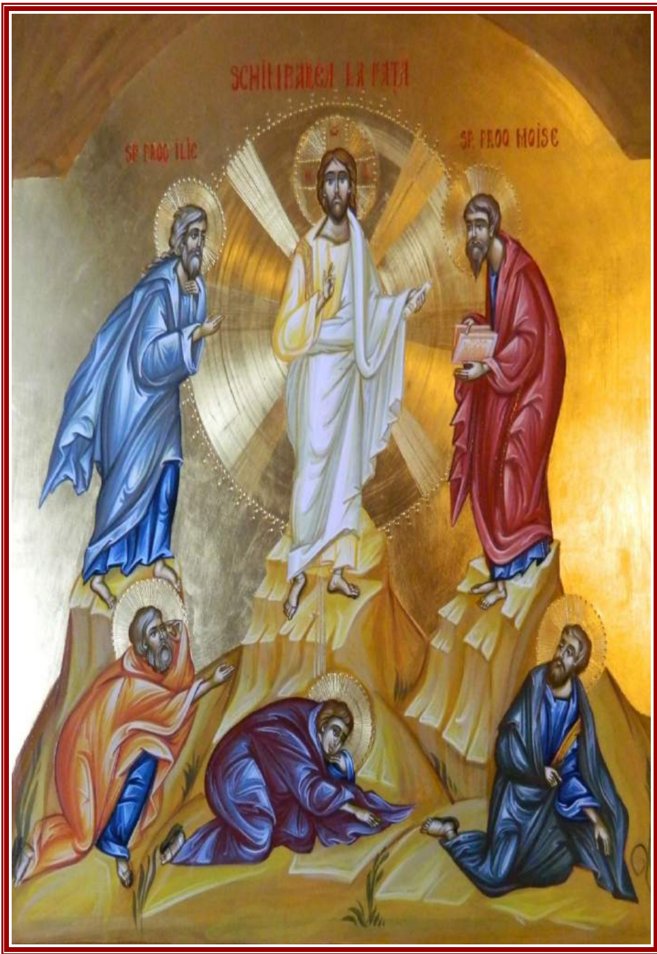
BULETIN PAROHIAL - AUGUST 2021