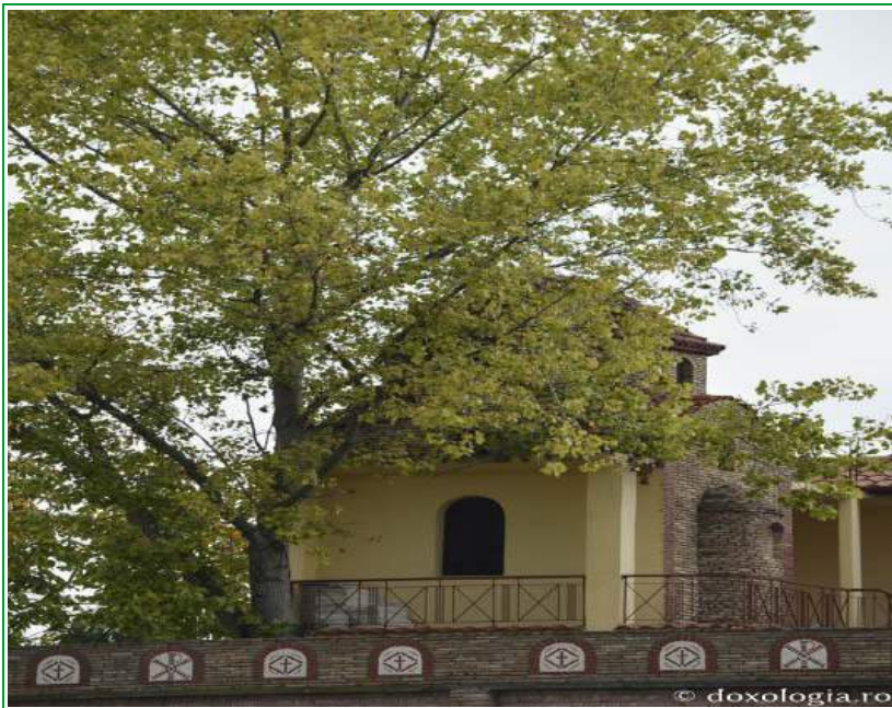
Manastirea Sfantului Efrem de pe Muntele Olimp, Grecia

Ortodoxia! Câte teme deschide astăzi! Câte cărți sfinte deschide astăzi! Câte minuni are să istorisească ziua de astăzi! Ce să