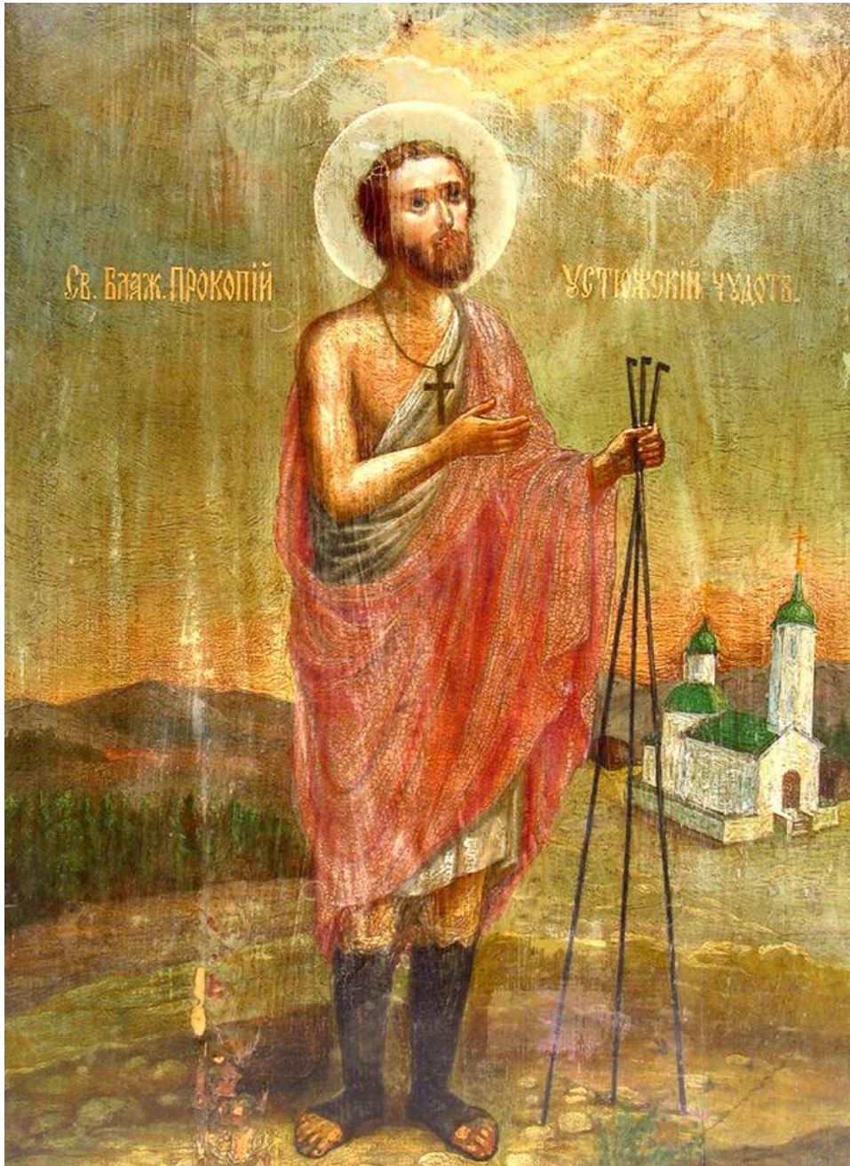
Sfantul Procopie, cel nebun pentru Hristos

Creștinismul a adus cu sine renașterea și înnoirea lumii vechi, după ce aceasta ajunsese să se descompună, secătuită de bătrânețe și sub presiunea unor forțe dizolvante, care îi veneau dinlăuntru. Cerescul foc al dragostei aruncat pe pământ de Mântuitorul (Lc. 12, 49) a făcut să se aprindă în inimile oamenilor, înăbușite de tirania simțurilor trupești, o nouă scânteie de viață, a făcut viu duhul în cei ce erau aproape morți prin greșelile lor (Efes. 2, 5) și, prin lucrarea harului, un mare număr de oameni a cunoscut o asemenea puternică râvnă spre evlavie, încât ea a devenit stihia de căpetenie a vieții lor spirituale, întreaga activitate a spiritului concentrându-se într-un efort continuu de răstignire a trupului, împreună cu patimile și cu poftele (Gal. 5, 24), de depășire a senzualității, de supunere a pornirilor naturii vătămate de păcat supremei legi spirituale, astfel încât, pe măsura puterilor sale, omul să sporească neconținut în duh, să trăiască, pe de-a-ntregul, în Dumnezeu și pentru Dumnezeu (Gal. 2,19).