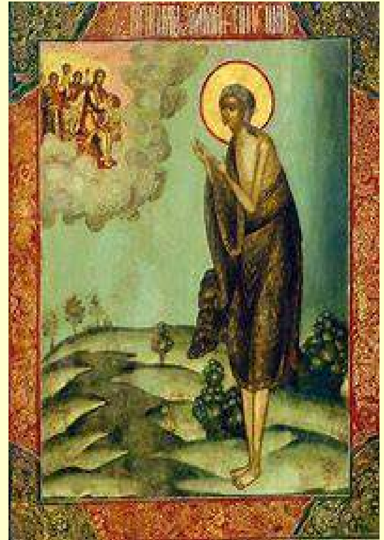
Cuvioasa Maria Egipteanca