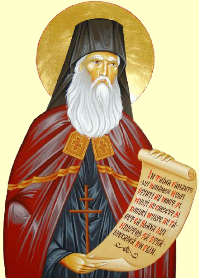
SFÂNTUL ANTIM IVIREANU (1650 - 1716)