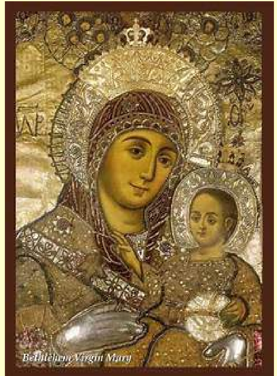
Beata Maria Virgin Mary